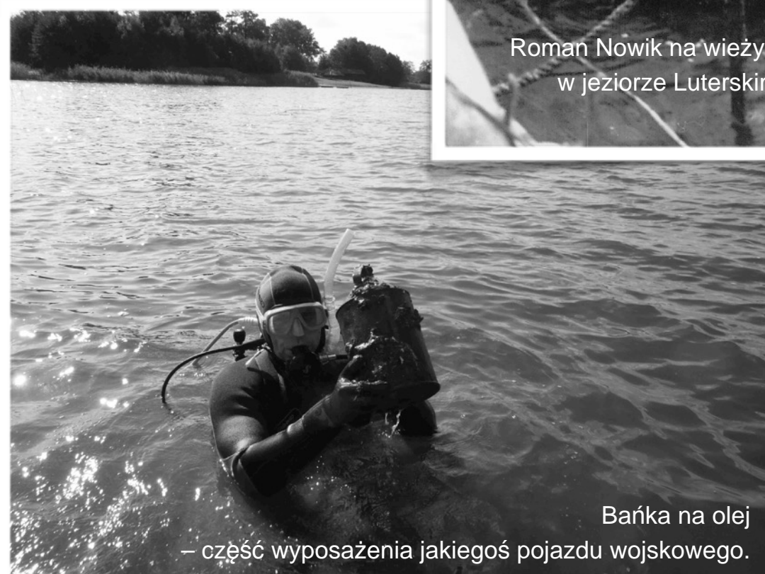
Bańka na olej – część wyposażenia jakiegoś pojazdu wojskowego.