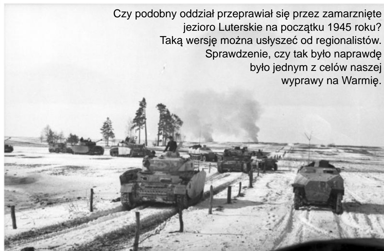
Czy podobny oddział przeprowadził się przez zamrożone jezioro Luterskie na początku 1945 roku? Taką wersję można usłyszeć od regionalistów. Sprawdzenie, czy tak było naprawdę było jednym z celów naszej wyprawy na Warmię.