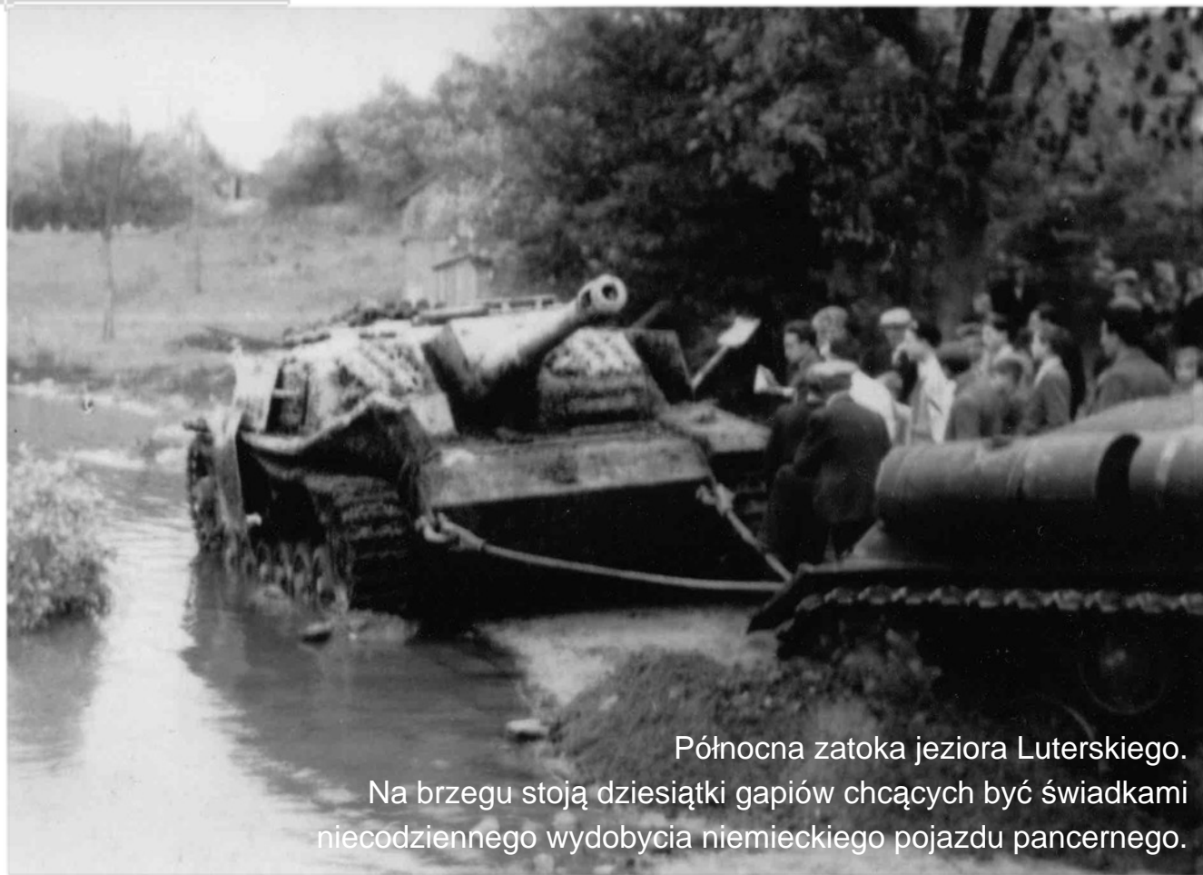
Północna zatoka jeziora Luterskiego. Na brzegu stoją dziesiątki gapiów chcących być świadkami niecodziennego wydobywania niemieckiego pojazdu pancernego.