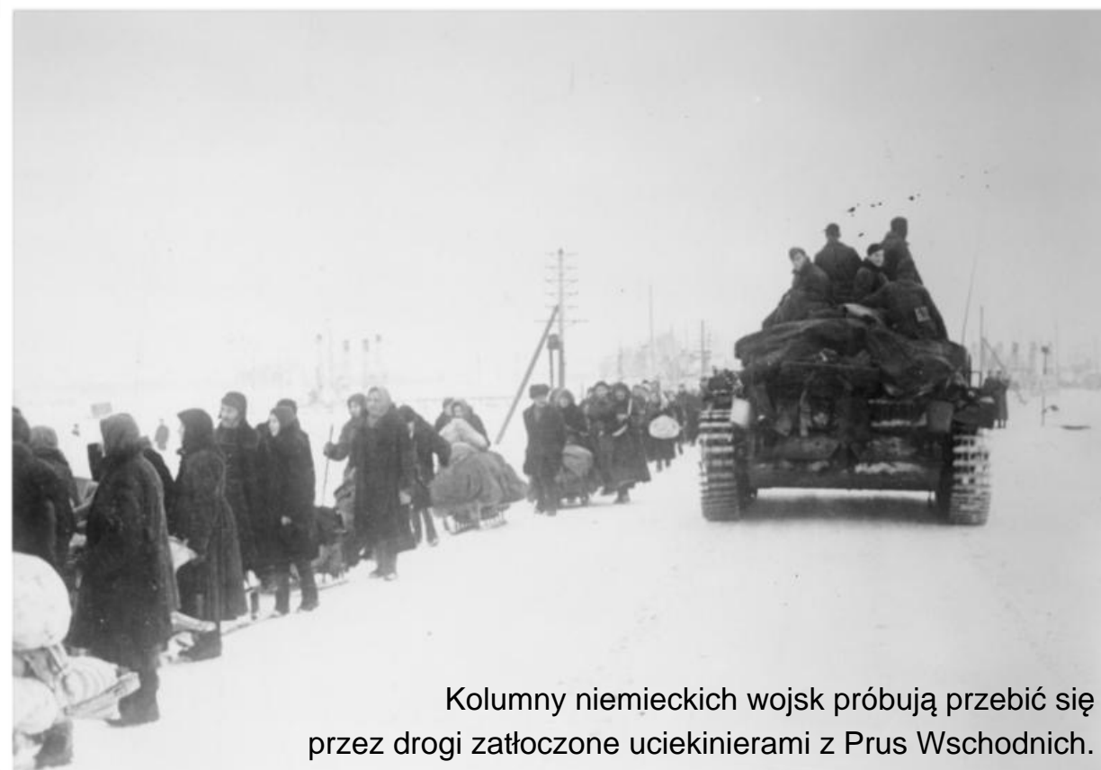
Kolumny niemieckich wojsk próbują przebić się przez drogi zatłoczone uciekinierami z Prus Wschodnich.

W czasie II wojny światowej Prusy Wschodnie były miejscem niezwykle zaciętych i krwawych walk . Ich ślady są widoczne do dziś w postaci ciągnących się kilometrami linii okopów, zapór, umocnień i stanowisk dowodzenia. Zimą 1944 i 1945 roku skute lodem warmińskie i mazurskie jeziora wykorzystywano jako trasę przemarszu wojska i drogę dramatycznej ucieczki ludności cywilnej. Wiele takich konwojów padło ofiarą bombardowań i ostrzału artyleryjskiego Armii Czerwonej . W ich wyniku zimne wody jezior stały się cmentarzem dla uciekinierów i miejscem spoczynku sprzętu wojskowego i pojazdów cywilnych – przyczyniając się do narodzin legend o zatopionych transportach wiozących broń, amunicję, archiwa, dzieła sztuki, a także prywatny majątek. Właśnie te historie skłoniły autorów książki do zbadania warmińskich jezior i sprawdzenia, czy na ich dnie w dalszym ciągu spoczywają zatopione ciężarówki, czołgi, a nawet... Bursztynowa Komnata .